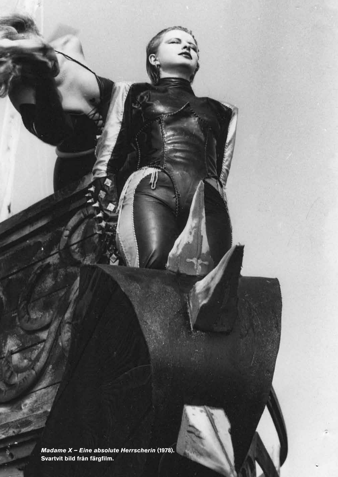
Madame X – Eine absolute Herrscherin (1978). Svartvit bild från färgfilm.