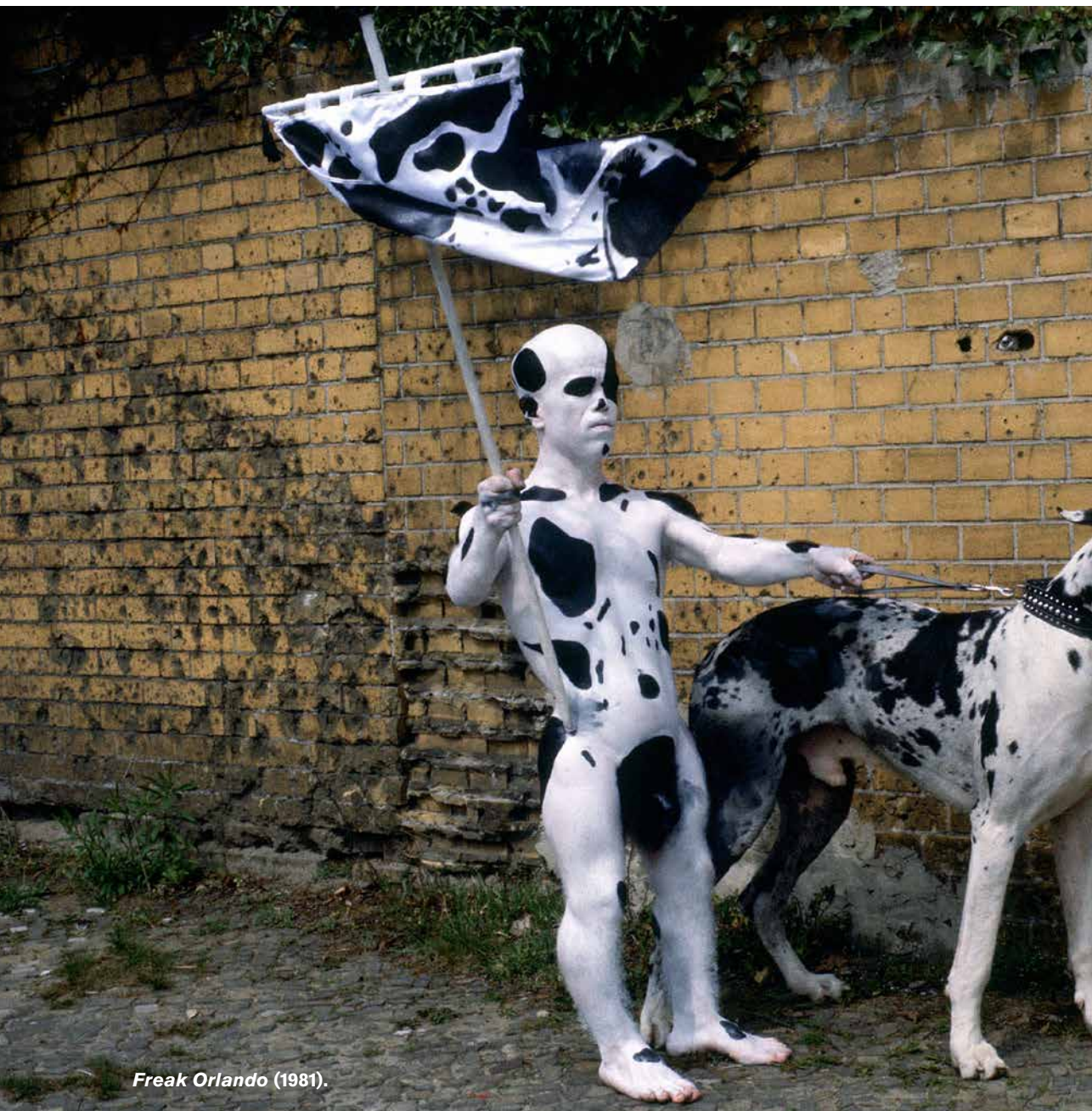
Freak Orlando (1981).

ifrån jägaren (som ger sig ut på jakt, dödar ett djur och återvänder hyllad med bytet) med spjutet som den raka berättelsens linje. Le Guin föreslår istället en dramaturgi som utgår ifrån samlaren. Väskan blir narrativets form istället för spjutet. Handlingen fungerar då alltså som en uppsamlare för filmen snarare än att utgöra poängen.