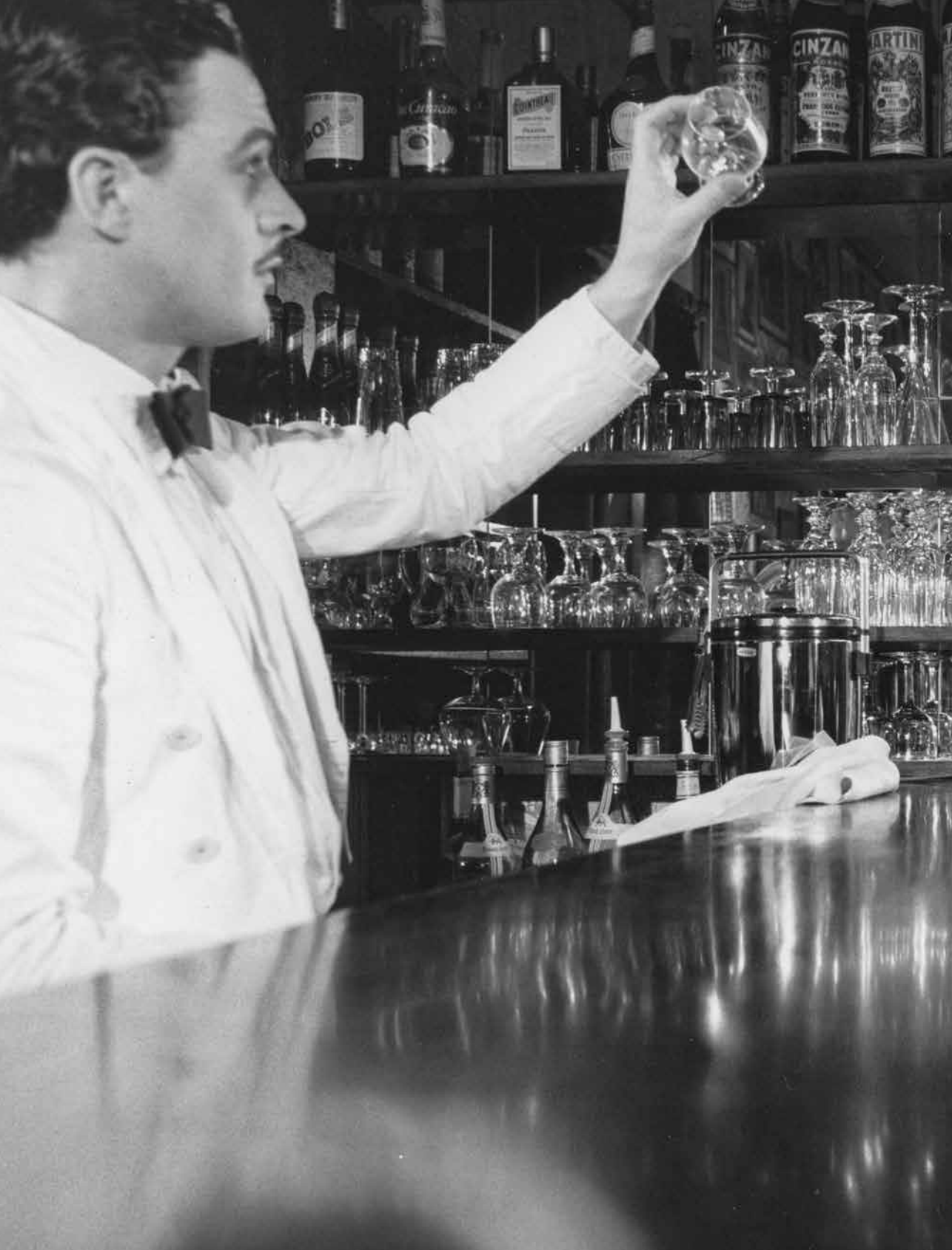
Porträtt av en kvinnlig drinkare; enkel resa (1979). Svartvit bild från färgfilm.