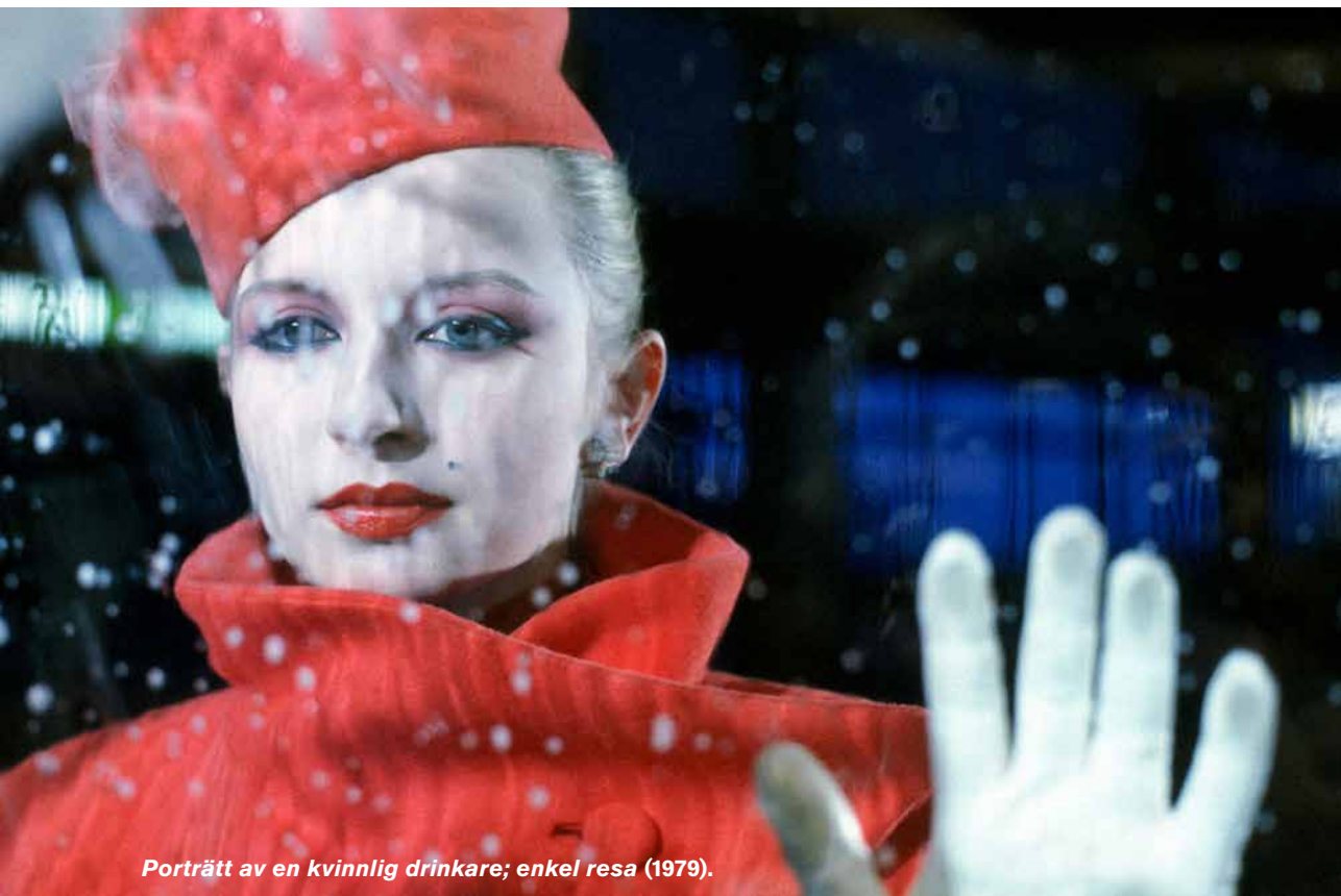
Porträtt av en kvinnlig drinkare; enkel resa (1979).