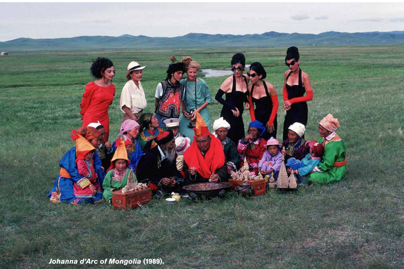
Johanna d'Arc of Mongolia (1989).