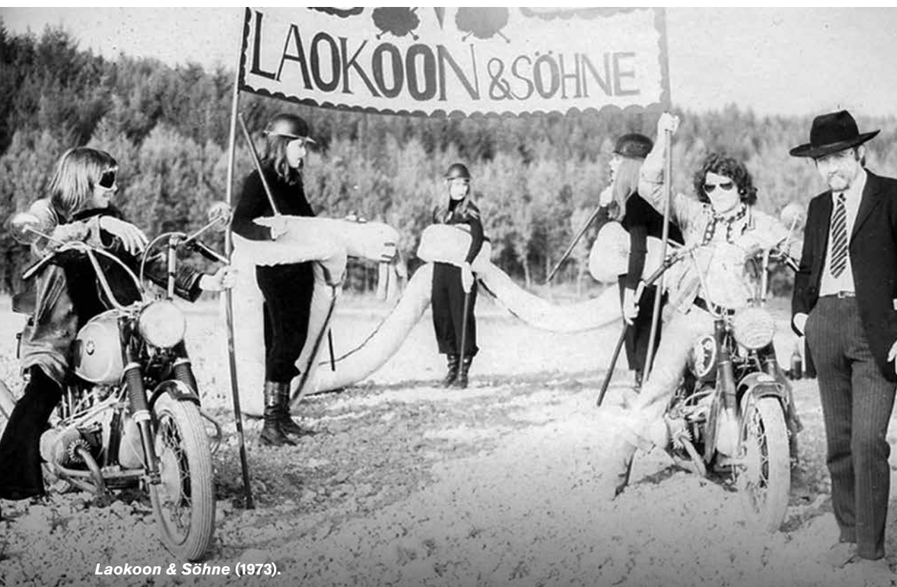
Laokoon & Söhne (1973).