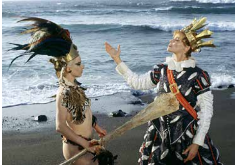
Dorian Gray im Spiegel der Boulevardpresse (1984).